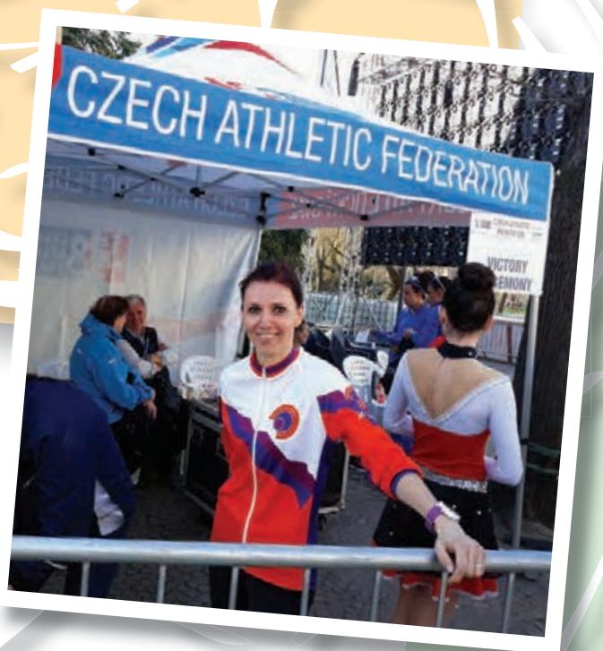
Naše členka před startem v barvách Klubu