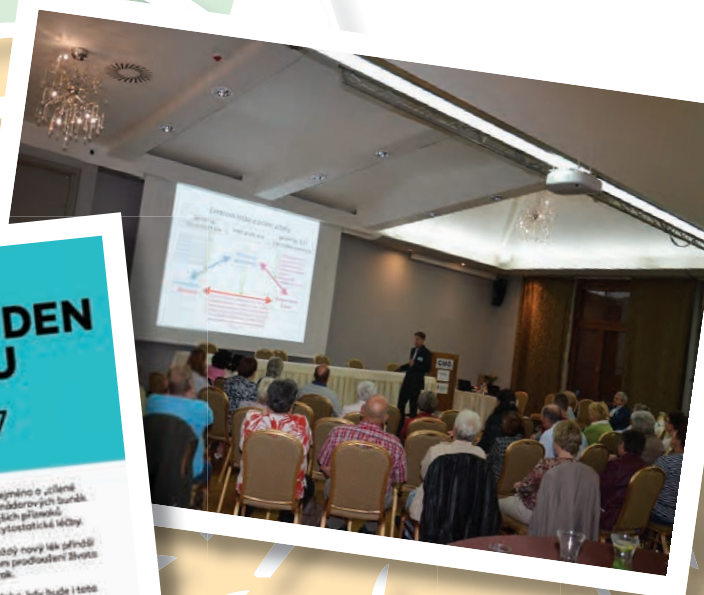
Diskusní klub s právníkem