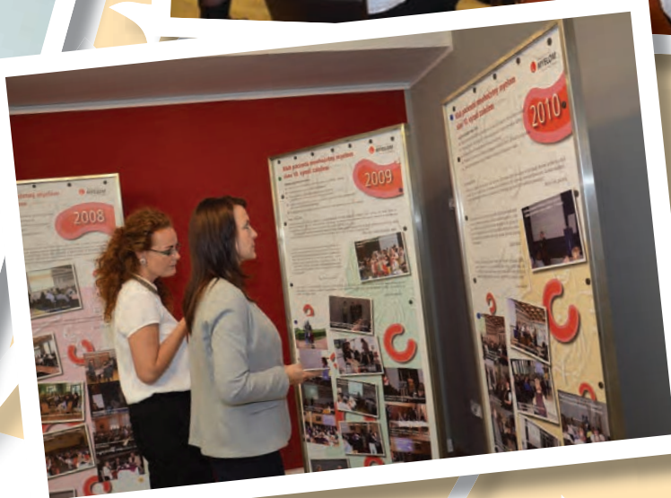
Historie Klubu pacientů v obrazech