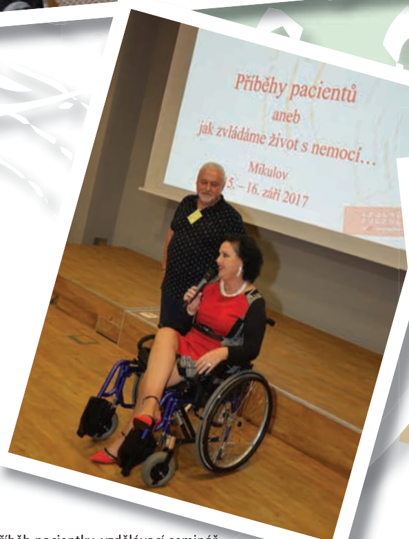
Příběh pacientky, vzdělávací seminář