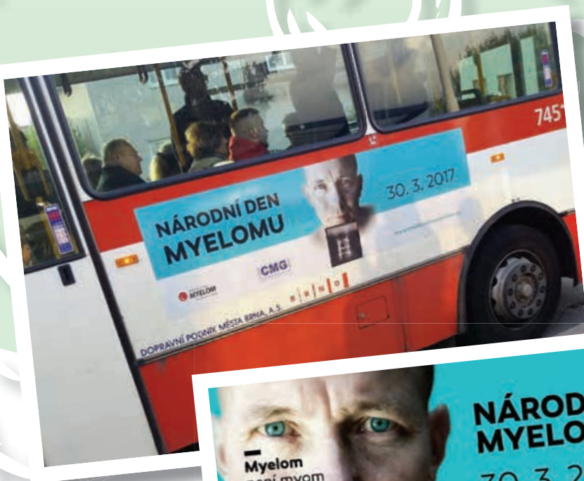
Informační kampaň o myelomu