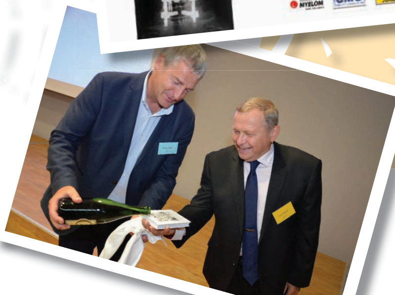
Křest knihy Z Poštákovy brašny