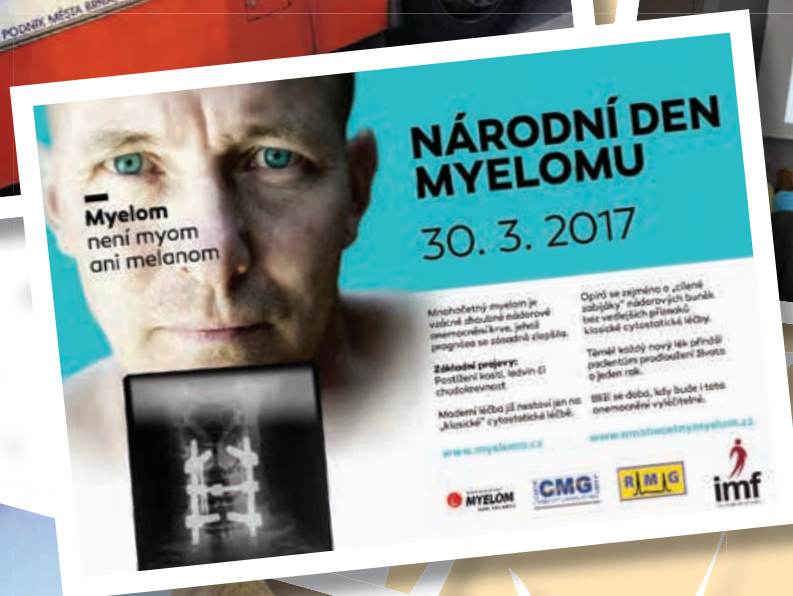
Národní den myelomu