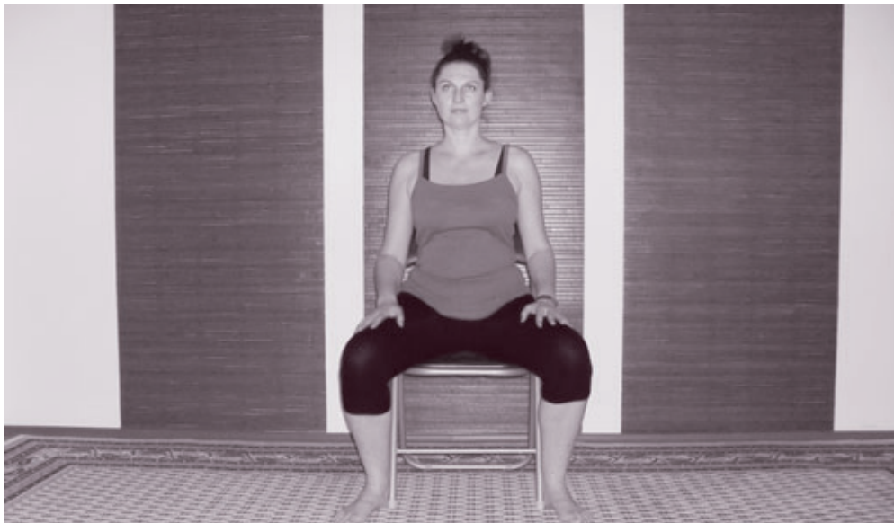
Obrázek 1- Pozice v sedu