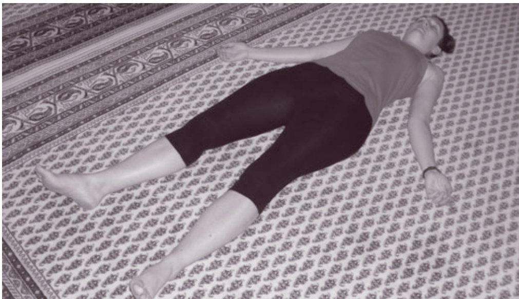
Obrázek 2 - Poloha blaženosti

Uvědomování si vlastního dýchání lze provádět i v lehu na zemi. Pokud cvičení provádíte v lehu, položte se na záda na koberec nebo podložku. Pokrčte si obě dolní končetiny, nadzvedněte mírně pánev a nechte ji dolehnout zpět na podložku. Protáhněte obě dolní končetiny a dejte si je asi 30 cm od sebe. Uvolněte svaly dolních končetin a špičky chodidel nechte vychýlit do stran. Protáhněte páteř a krk po podložce. Horní končetiny dejte mírně do stran směrem od trupu s dlaněmi otočenými směrem ke stropu. Protáhněte horní končetiny směrem od ramen k prstům a poté je uvolněte a nechte dolehnout na podložku. Zavřete oči („poloha blaženosti“ – viz obrázek 2). Zavřete ústa tak, aby se rty jemně dotýkaly a dýchejte pouze nosem (nadechujte i vydechujte). Dále již cvičení probíhá stejně jako v sedu.